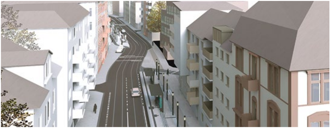
▲ Entwurf der neuen Station „Musterschule“ stadteinwärts von Kölling Architekten BDA. Das Motiv auf dem Titel zeigt den Entwurf der neuen Station „Glauburgstraße“ von Just/Burgeff Architekten.