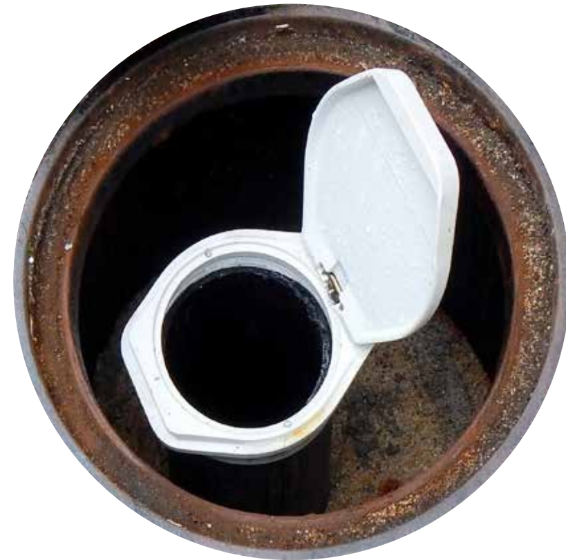
Blick in eine fertiggestellte Grundwassermessstelle